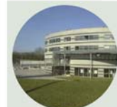
Agropolis International à 100 m du Zoo « Lunaret »